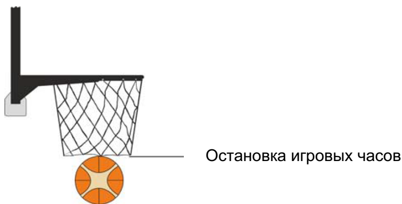
Рисунок 2. Попадание засчитывается

игровые часы должны быть остановлены, когда мяч остается в корзине или полностью пройдет через нее, как показано на Рис.2.