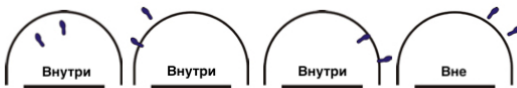
Рисунок 5. Положение игрока внутри/вне области полукруга без фолов столкновений

33-4 Пример: А1 выполняет бросок в прыжке, который начинается вне области полукруга. А1 сталкивается с В1, контактирующим с областью полукруга.