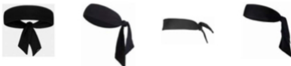
Рисунок 1. Пример головных повязок в виде косынки

4-4 Определение. Ношение головных повязок в виде косынки не разрешается.